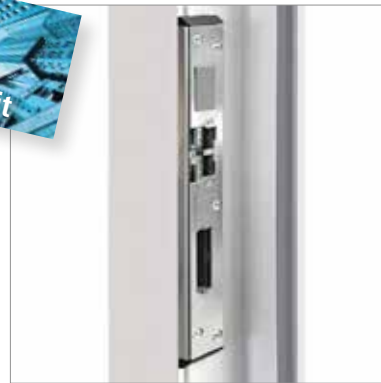
Drei massive Schließbleche sichern die Tür.