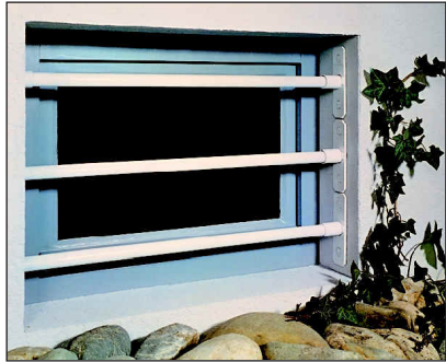
Modell SECURIX® Universal

Komplettgitter 110cm Bestellnummer für Ausführung - weiß: 304105W - schwarz: 304105S