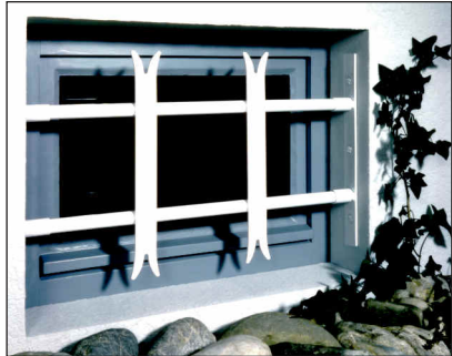
Modell SECURIX® Classic

Darüber hinaus sind Einzelstreben 110cm bzw. 150cm lang sowie Einfach- und Doppel- seitenteile in weiß, schwarz und feuer- verzinkt lieferbar.