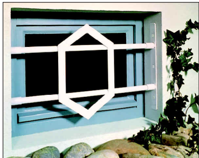
Modell SECURIX® 2000