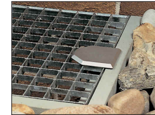
Ansicht von oben, beide Typen